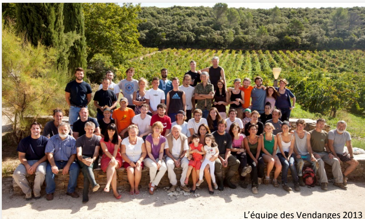
L'équipe des Vendanges 2013

Au final, une très belle récolte, avec une production équivalente à celle de l'an passé.