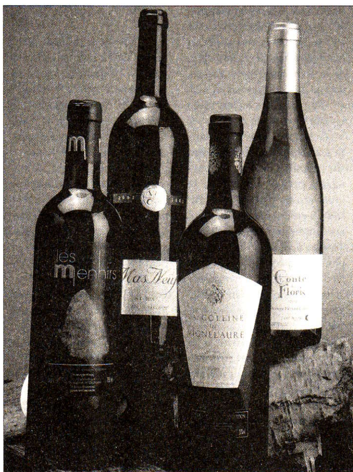
Le Languedoc, avec notamment le domaine Le Conte des Floris et le château Mas Neuf, se distingue en vins de pays, mais la Provence et les vins de Loire ne sont pas en reste.